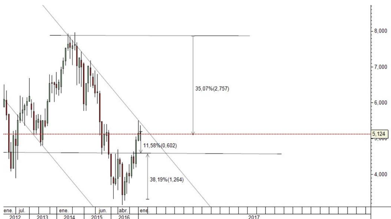
Gráfico semanal Banco Santander:

En 2014 alcanza resistencia en niveles próximos a los 8 euros coincidiendo con la línea superior del canal bajista iniciado tras la crisis de 2007/2008. Tras la aparición de ese patrón técnico se produjo una caída del 60% del valor del activo, prolongándose dicha caída hasta abril de 2016 donde rebota en mínimos históricos (cercanos a la línea inferior del canal bajista) hacia un período alcista (50% de revalorización del activo) que le ha llevado en el momento actual a la zona de precio próxima a la línea superior del canal bajista.